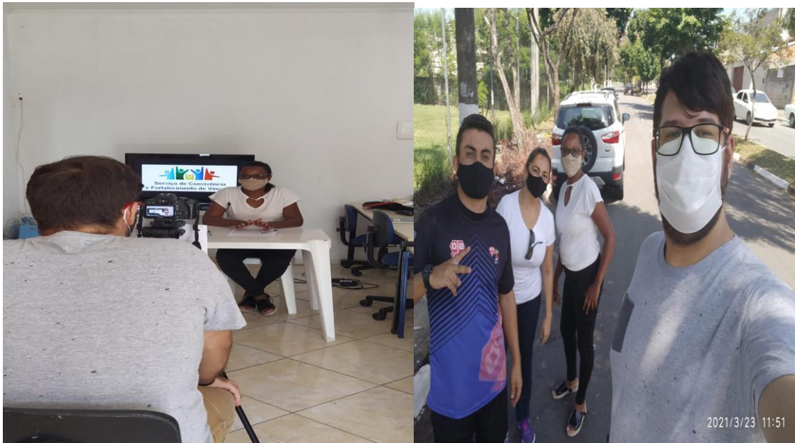
Execução das atividades socioeducativas, físicas e inclusão digital