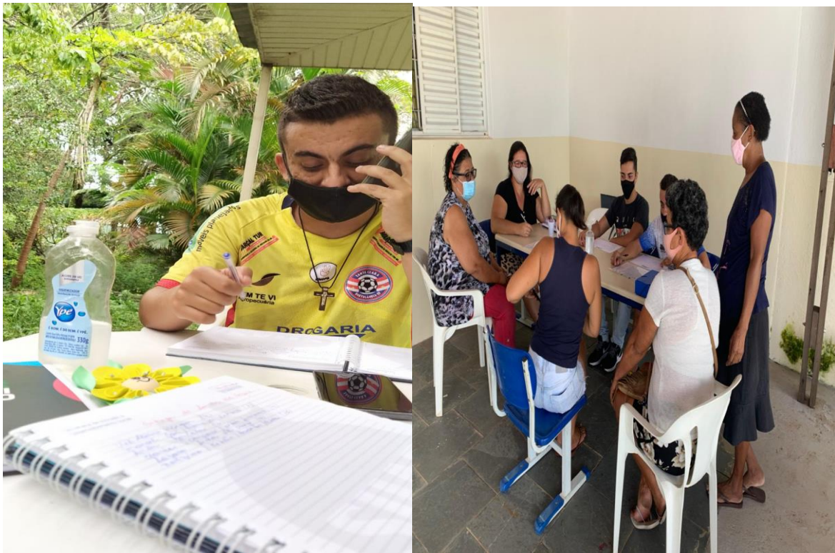
Captação e inscrição dos usuários do SCFV presencial e contato telefonico