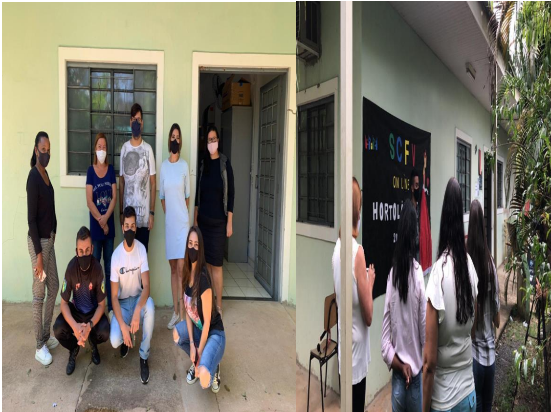
Elaboração e montagem das atividades do SCFV