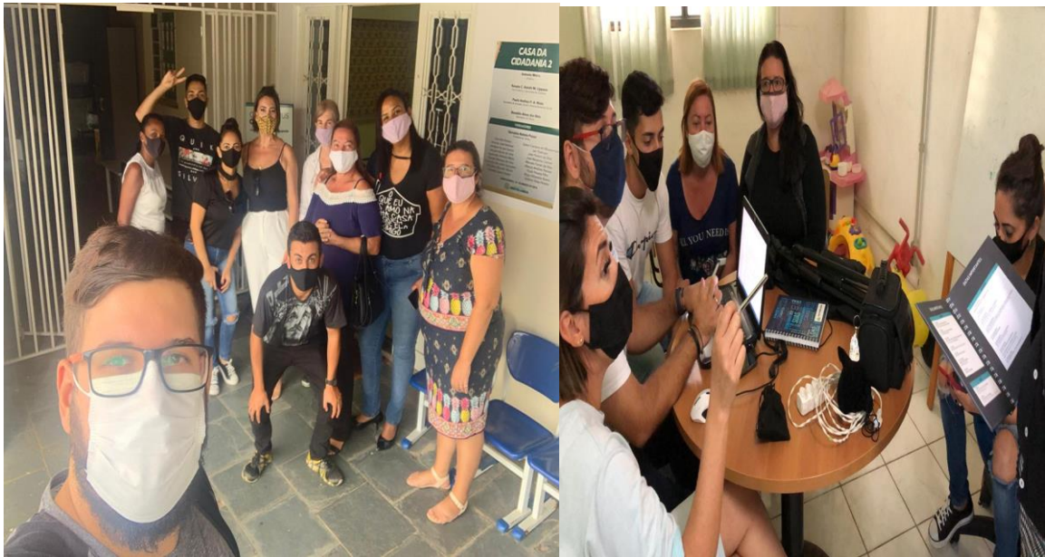
Reuniões com a equipe do SCFV e com CCS Brasil