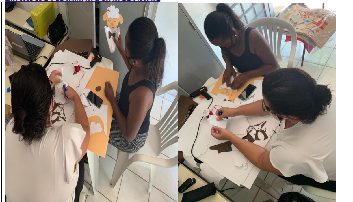
Elaboração e confecção da lembrancinha de páscoa