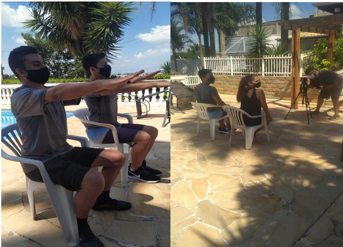
Execução das atividades do SCFV