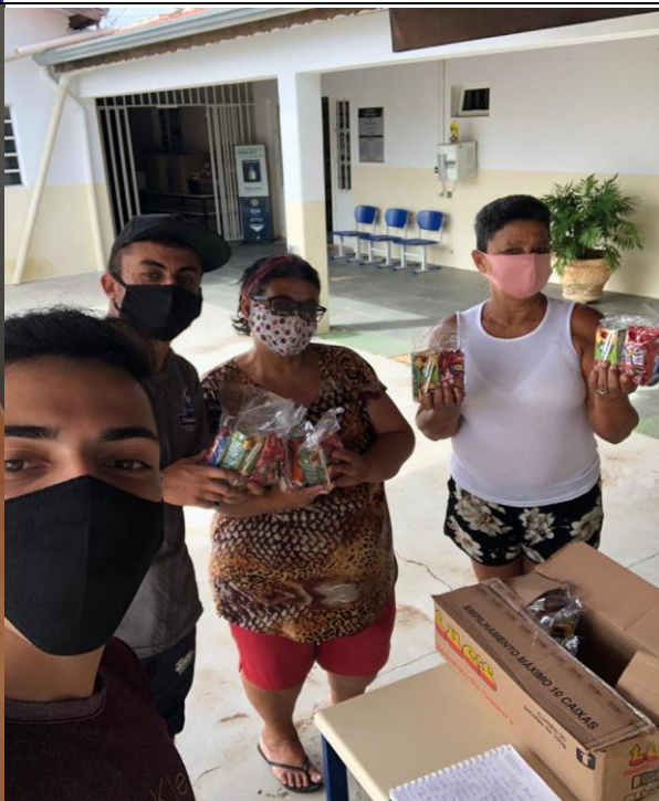
Separação e distribuição dos kits lanche para os usuarios do SCFV