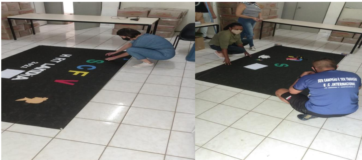
Confecção do painel do SCFV