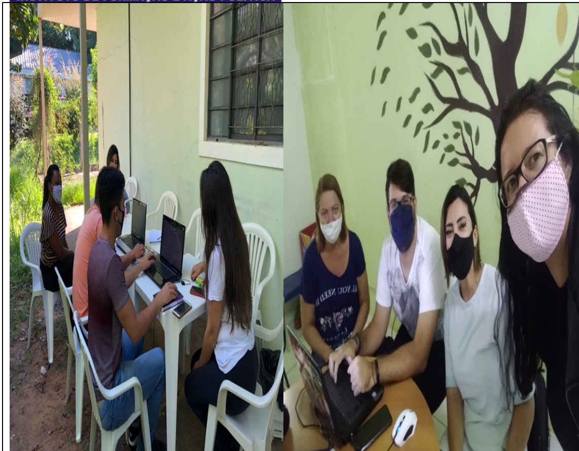
Reunião com a equipe: planejamento das atividades semanais