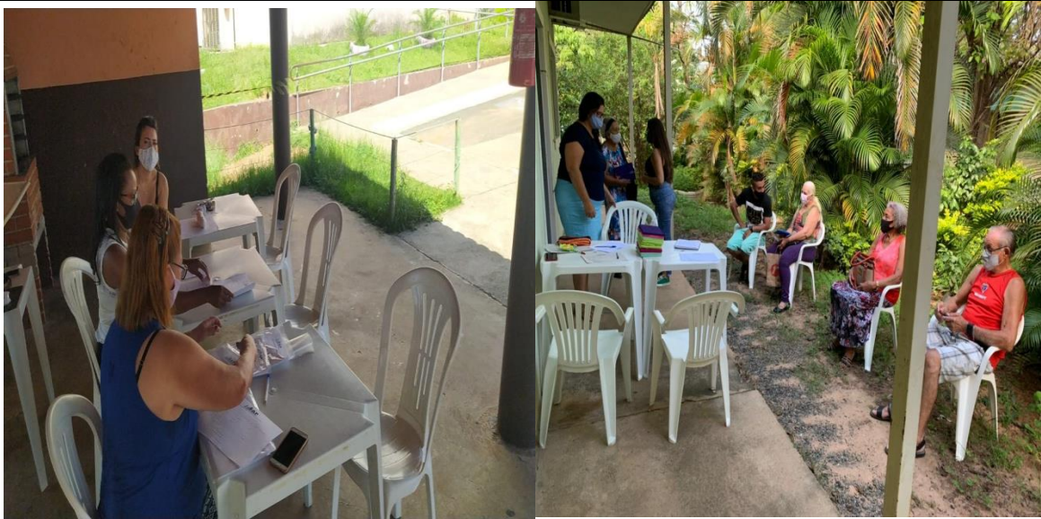
Captação e inscrição dos usuarios no SCFV